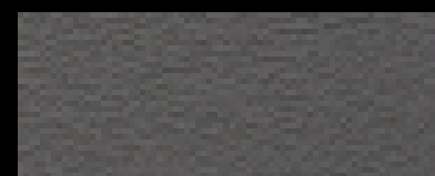
1358 silbergrau dunkel