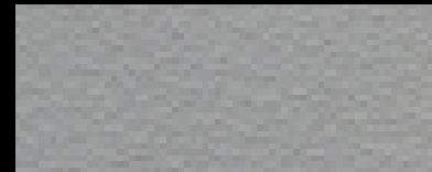
1355 silbergrau hell