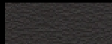
1382 anthrazit hell